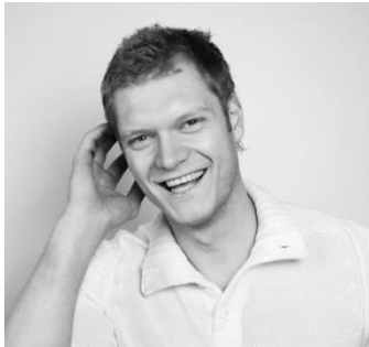
Johannes Bitter Handball-Weltmeister

Prominente engagieren sich als Botschafter und Botschafterinnen für unsere Stiftung Mittagskinder: