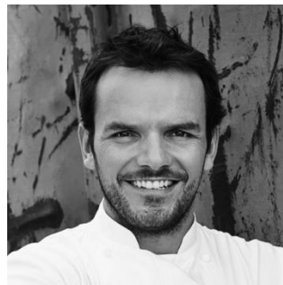
Steffen Henssler TV-Koch und Gastronom